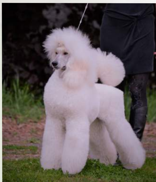
Baby stříh - Calliste du Cristaux Glace's

Na údržbu nejnáročnějším stříhem je již výše zmíněná „bejbina“, oficiálně baby stříh . Název pochází z dob, kdy byl tento stříh povolen jen do třídy mladých (do roku 1987). V současnosti je u nás u menších velikostních rázů nejčastějším výstavním stříhem. Velcí pudlové jsou obvykle v „bejbině“ vystavováni jen jako mladí. Baby stříh je časově nejnáročnější „díky“ tomu, že srst je na všech partiích s výjimkou zádě dlouhá. Jeho nespornou výhodou je fakt, že jím lze zamaskovat nějaké ty nedostatky v tělesné stavbě. Pro oko laika je baby stříh velice líbivý a atraktivní, bez pro laiky nepřijatelné extravagance.