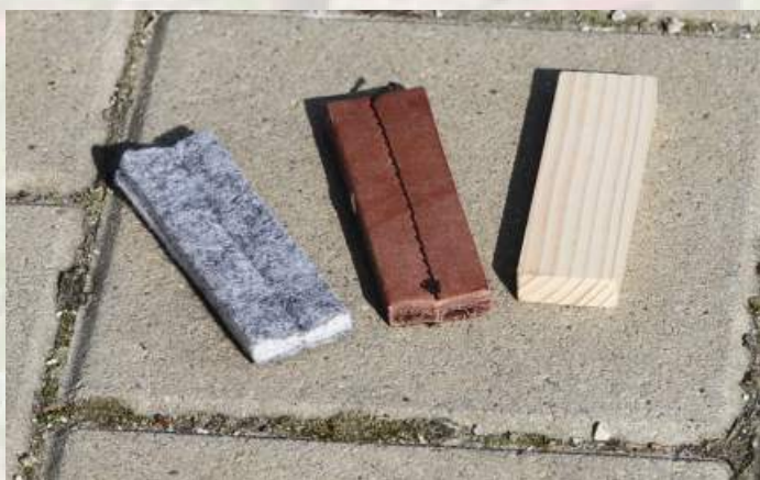
Standardní předměty z materiálu filc, kůže, dřevo

Máme krásné, rychlé a přesvědčivé označení předmětu, pes nesleduje nás, ale předmět, a je mu jedno, v jaké pozici se nacházíme. A tak je na čase zvednout další kritérium – a to je materiál. Podle zkušebnímu řádu můžeme používat jakékoliv dobře pachovatelné materiály, jako jsou např. textil, filc, kůže, dřevo nebo plast. Na sportovních stopách nikdy nenajdeme předměty z kovu. A abychom byli připravení na všechno, už v základním tréninku naučíme psa na různé materiály. Předměty si buď můžete zakoupit – hodně výrobců kynologických potřeb prodává předměty, které přesně odpovídají zkušebnímu řádu – nebo si je můžete sami doma snadno vyrobit. Zkušený stopař nic nevyhodí, ale všechno spotřebuje na předměty. Přesný rozměr v tuto chvíli nehraje až takovou roli, důležité bude střídání materiálu a kvalitní napachování předmětů před použitím. Hodit se může: jakýkoliv zbytek koberce nebo silnější látky, na kousky můžeme nařezat nehodící se dřevěné šatové ramínko, kožený pásek, ze kterého už jsme „vyrostli“, nebo plastovou hadici či víčko od malé krabičky. Stejně jako jsme v minulých dílech řešili barvu pamlsku vzhledem k barvě terénu, budeme jednou stejným způsobem řešit i barvu předmětu tak, aby pro psa nebyl příliš viditelný. Ale v tuto chvíli nám jde pouze o to, abychom střídali materiály a naučili psa spolehlivě označovat cokoli, co má náš pach. Třeba i kreditku nebo klíče od auta, aby ho v budoucnu na stopě nic nezaskočilo.