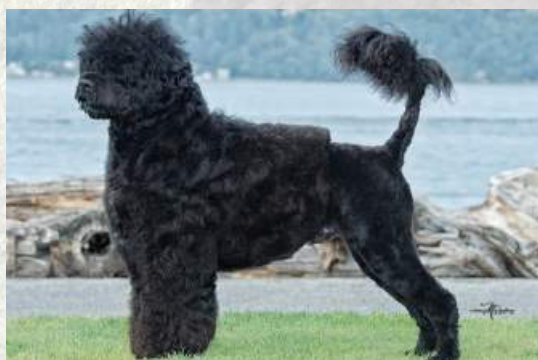
Portugalský vodní pes