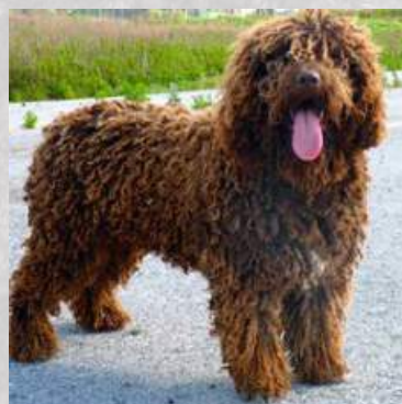
Španělský vodní pes