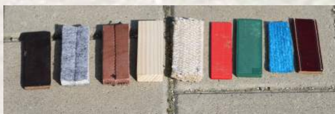
Předměty z různých materiálů