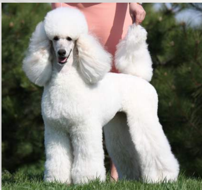
Moderní stříh fen C.I.B Britany Bílá šše vyložen slusí.

Stříh moderní , který je už dávno moderní jen u pouličních pudlů, je v současné době na ústupu. Třebaže na výstavách se s modernou prakticky nesetkáme, zůstává nejoblíbenějším stříhem domácích mazlíčků.