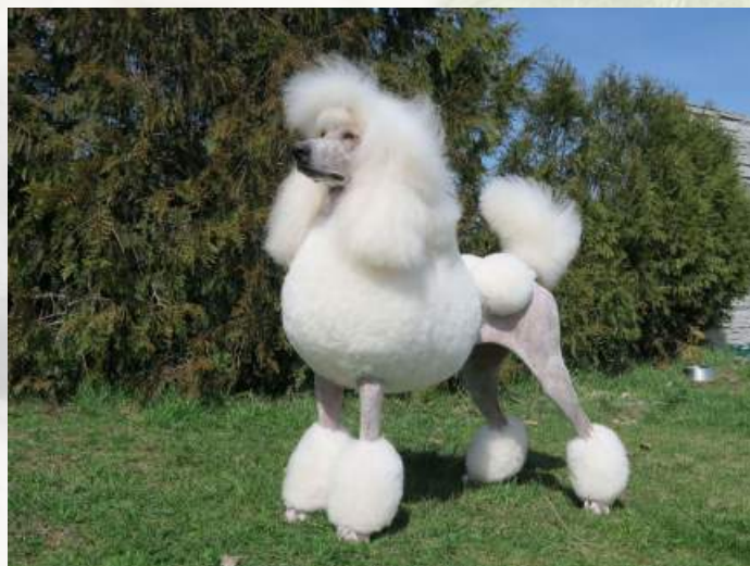
Americký kontinentální stříh - Catherine Princess du Cristaux Glace's

Ta naopak nechybí stříhu, který „kraluje“ u výstavních králováků. Je to americký kontinentální stříh . Ze všech úprav je to právě „kontinentál“, který dává nejvíce vyniknout eleganci pudla. Je to bez diskuze „top“ stříh pro „top“ jedince. Dává nemilosrdně vyniknout všem nedostatkům psa a nastříhaný na průměrném zvířeti ztrácí svou vrcholnou eleganci. Přesto do něho vystavovatelé velkých pudlů masově upravují své psy – důvodem může být i skutečnost, že kontinentál ušetří díky oholeným partiím majiteli značnou část práce. Osobně si stojím za názorem, že stříhat americký kontinentální stříh na psovi s delším formátem, s ne úplně dokonalým úhlením, na psovi s krátkým krkem a se srstí nedostatečné délky či kvality, případně na mladém, nevyzrálém zvířeti, je naprosto kontraproduktivní a výsledkem je jen divně vypadající zvíře.