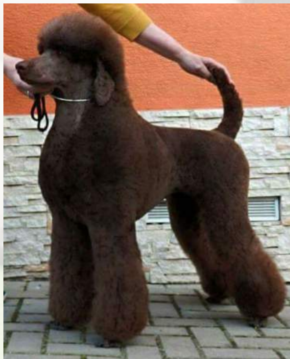
Skandinávský stříh - Bonie Brown Lady Sorbona